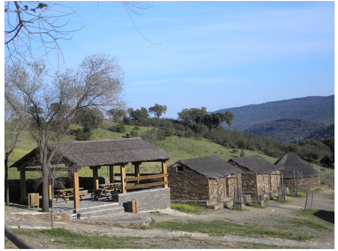
Merendero y Chozos Villareal