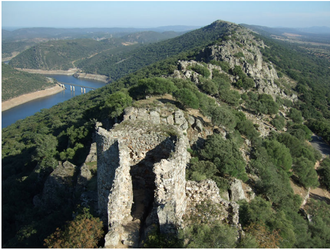
Vistas de Monfragüe desde el Castillo