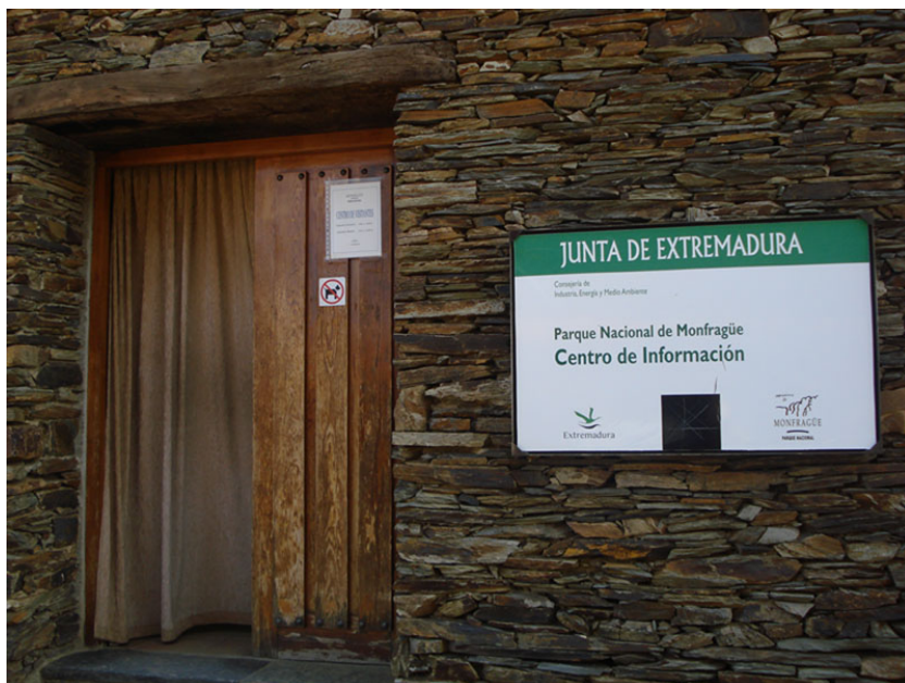
Entrada al Centro de Información del Visitante